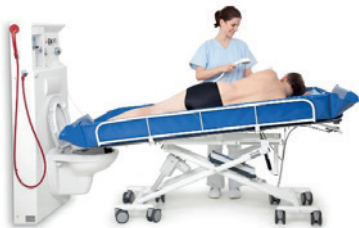
Un bloc douche avec WC intégré et un chariot douche

En fonction de l'établissement et de la taille de la salle, il est possible d'intégrer d'autres matériels :